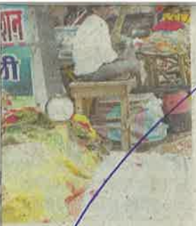
फूलों की दुकान • जागद्वण